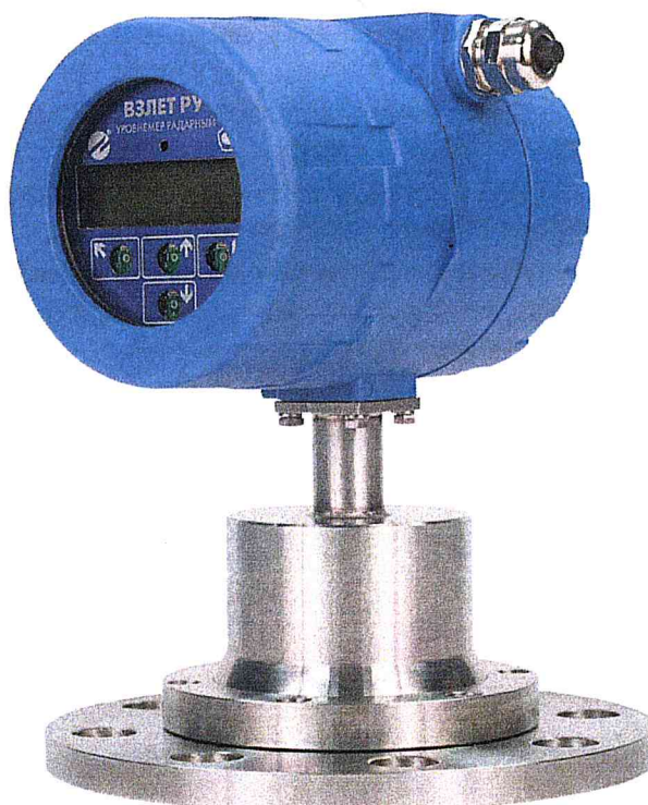
Рисунок 1 – Общий вид уровнемеров радарных «ВЗЛЕТ РУ»

Общий вид уровнемеров приведен на рисунке 1.