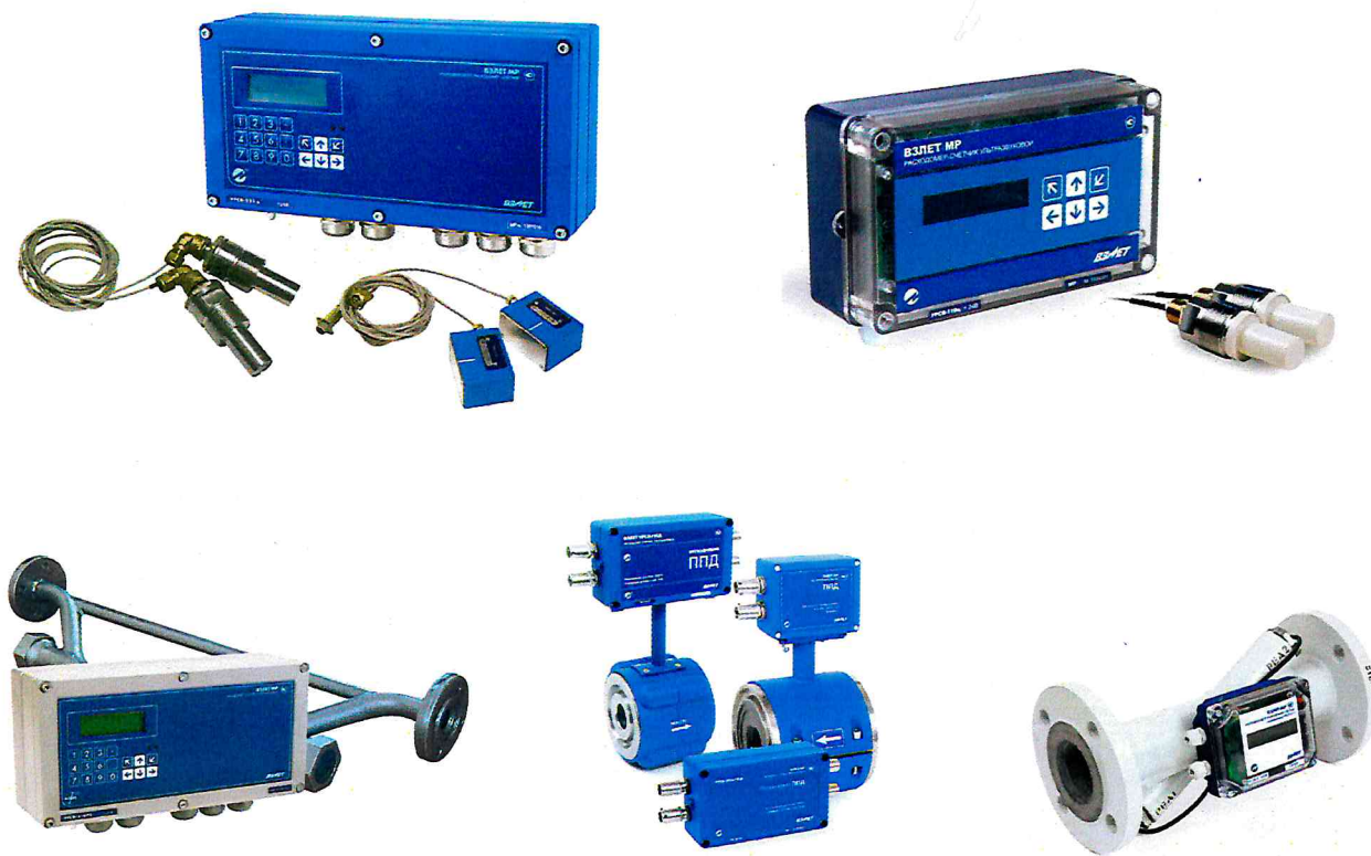
Рисунок 1 – Общий вид расходомеров-счетчиков ультразвуковых «ВЗЛЕТ МР» различных исполнений

Общий вид расходомеров-счетчиков ультразвуковых «ВЗЛЕТ МР» представлен на рисунке 1.