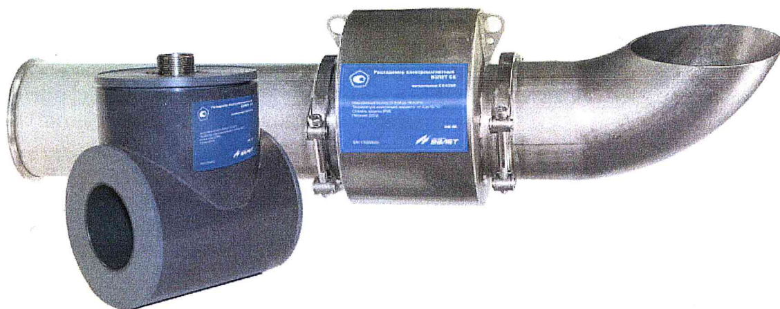
Рисунок 1 – Общий вид расходомеров-счетчиков электромагнитных ВЗЛЕТ СК

Пломбировка от несанкционированного доступа расходомеров-счетчиков электромагнитных ВЗЛЕТ СК осуществляется нанесением знака поверки давлением на свинцовую (пластмассовую) пломбу, установленную на контрольной проволоке, пропущенную через пломбировочные отверстия винтов крепления разъема на корпусе расходомера-счетчика электромагнитного ВЗЛЕТ СК. Схема пломбировки от несанкционированного доступа, обозначение места нанесения знака поверки представлена на рисунке 2.