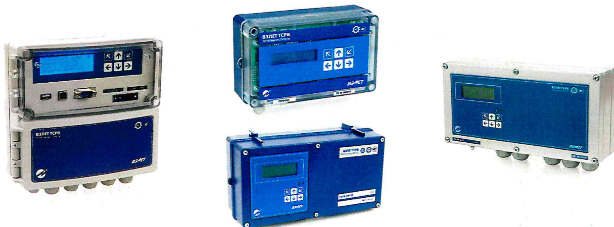
Рисунок 1 – Общий вид тепловычислителей ВЗЛЕТ ТСРВ

Пломбировка от несанкционированного доступа тепловычислителей ВЗЛЕТ ТСРВ осуществляется нанесением знака поверки давлением на пломбировочную мастику, расположенную в пластиковом колпачке (или пломбировочной чашке с металлической скобой), закрывающем контактную пару разрешения модификации калибровочных параметров на электронной плате тепловычислителя ВЗЛЕТ ТСРВ, а также нанесением знака поверки давлением на пломбировочную мастику расположенную на винте крепления защитного экрана электронной платы тепловычислителей ТСРВ (только для исполнений ТСРВ-024М, ТСРВ-024М+, ТСРВ-025, ТСРВ-027, ТСРВ-042). Места пломбировки тепловычислителей ВЗЛЕТ ТСРВ различных исполнений приведены на рисунке 2.